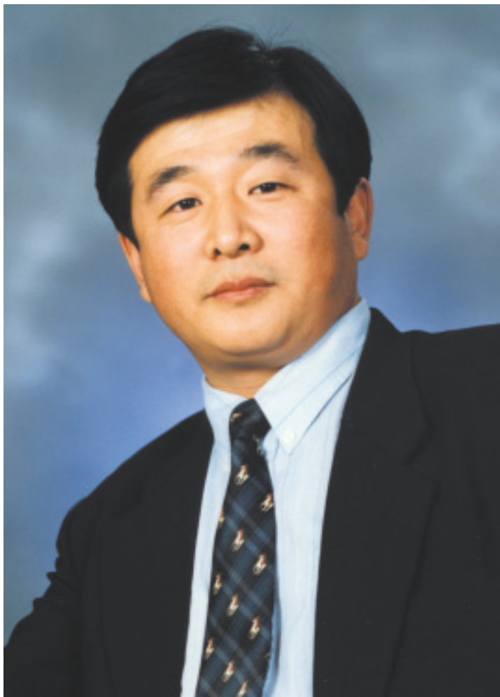
MEISTER LI HONGZHI